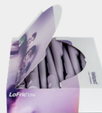
Confezione comodo per l'uso.

*Lunghezza effettiva, lunghezza del catetere che può essere inserita nel corpo.